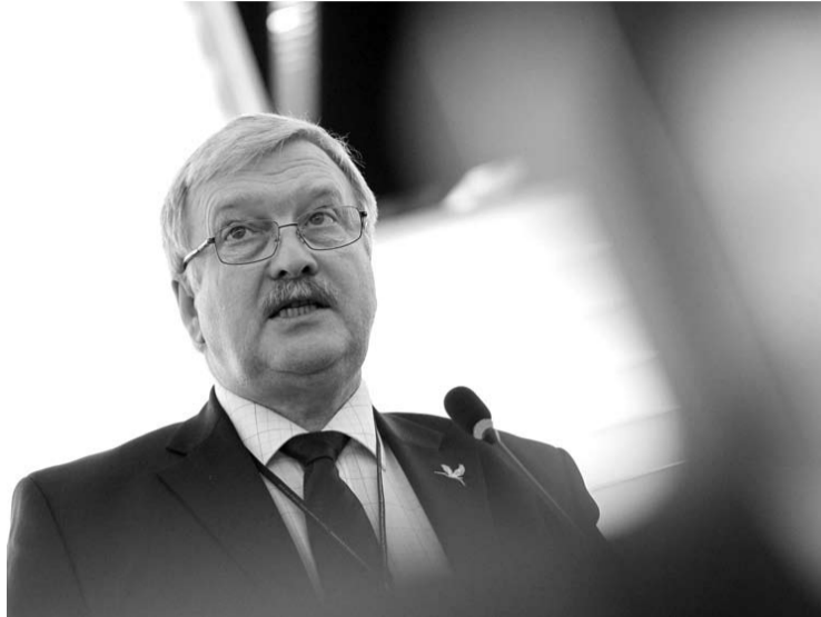
Europos Parlamento narys Bronis Ropė.

kad mūsų darbas pagaliau davė užtikrintus rezultatus. Lietuva 2021-2027 m. ir toliau naudosis didžiausia galima ES parama regionams, nes mums pavyko įtikinti Europos Komisiją, kad skaičiai apie Lietuvos žmonių pragyvenimą, kuriais, tarp kitko, buvo manipuliuojama, siekiant įvesti eurą, nėra tikslūs, o žmonių pragyvenimo lygis už sostinės ribų, toli gražu, nėra toks aukštas kaip Vilniuje. Iki šiol skirtumai kai kuriose srityse yra kone dvigubi. Eurą jau turime, tačiau negalėjau leisti, kad dėl to Anykščiuose, Tauragėje, Rokiškyje, Kaune ar kuriame nors kitame rajone gyvenantys žmonės prarastų dideles ES investicijas. Galime atsipūsti, kad bent jau Europos Sąjungos dokumentuose reikšmingus pinigus regionų vystymuisi pavyko išsaugoti.