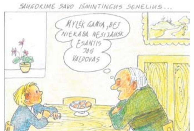
Piešė Albinas GVOZDAS